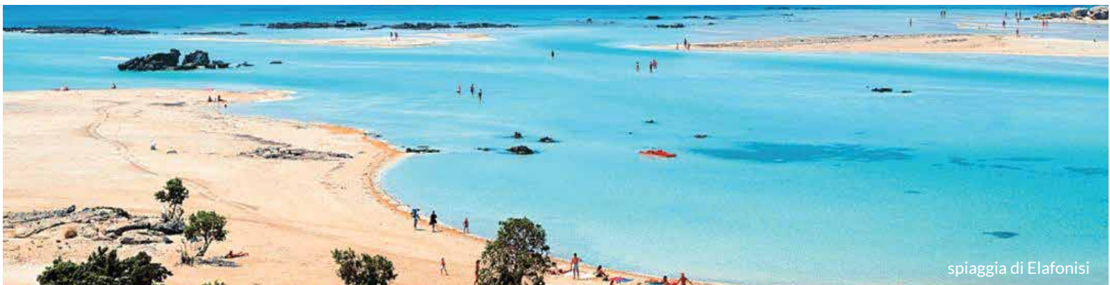
spiaggia di Elafonisi